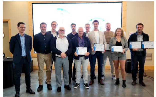
Certificats remis aux sites labellisés Label RSE.

Mardi 8 octobre, l'association UNICEM entreprises engagées a célébré la remise officielle des certificats, décernés aux exploitants régionaux de carrières et aux producteurs de béton prêt à l'emploi, engagés dans la mise en œuvre des démarches de progrès.