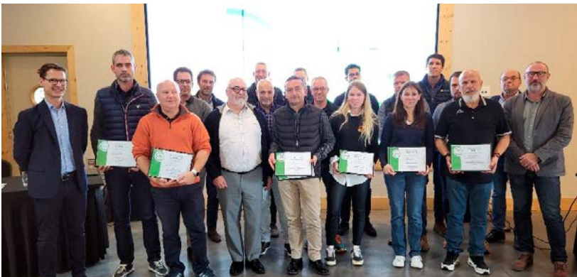
Certificats remis aux sites labellisés Cap environnement.